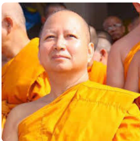
พระพรหมบัณฑิต ๔ (ประยูร ธมฺมจิตฺโต), ศ.,ดร.