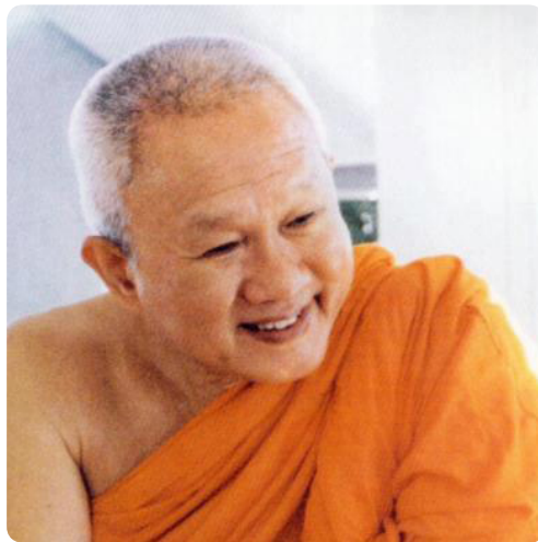
สมเด็จพระพุทธโฆษาจารย์ (ประยุทธ์ ปยุตฺโต)

โลกยุคปัจจุบันมีนักปราชญ์มากมายที่ยังเป็นความหวังของสังคม หากสังคมไม่เพิกเฉยต่อคำชี้แนะของนักปราชญ์เหล่านั้น คือ